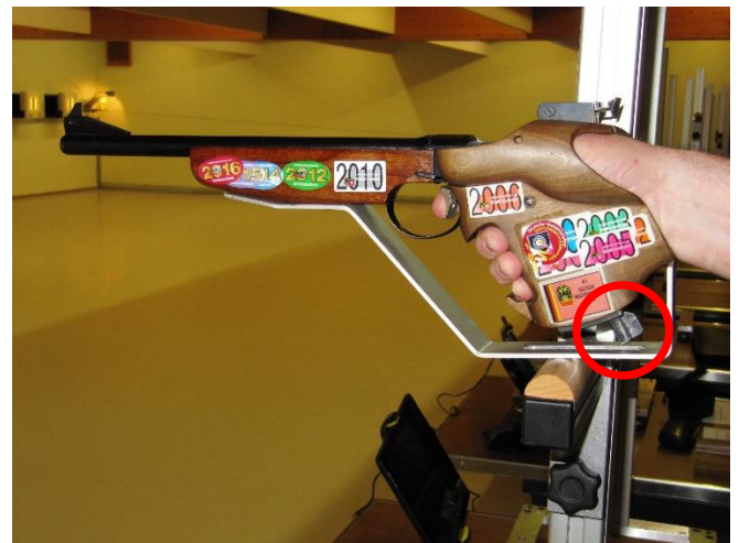
Anschlagart: „Freie Pistole Auflage“ (Ein Anschlagen des Ladehebels an der Waffenaufgabe darf nicht möglich sein)

Die Hand des Schützen umfasst den Pistolengriff. Der Handballen oder der Pistolengriff an seiner tiefsten Stelle, gelten als Auflagepunkt der Pistole auf der Auflage. Das Handgelenk muss im Anschlag völlig frei sein. Ein Arretieren oder Anschlagen seitlich und auf der Auflage ist nicht gestattet.