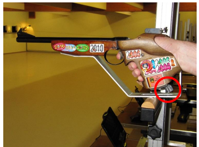
Anschlagart: „Freie Pistole Auflage“ (Ein Anschlagen des Ladehebels an der Waffenaufgabe darf nicht möglich sein)

Die Hand des Schützen umfasst den Pistolengriff. Der Handballen oder der Pistolengriff an seiner tiefsten Stelle, gelten als Auflagepunkt der Pistole auf der Auflage. Das Handgelenk muss im Anschlag völlig frei sein. Ein Arretieren oder Anschlagen seitlich und auf der Auflage ist nicht gestattet.