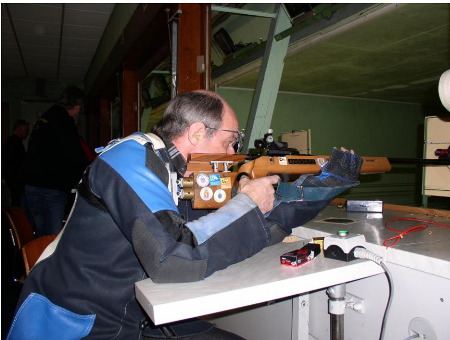
Anschlag sitzend in der Disziplin „KK sitzend mit Gurt“

Der Schütze sitzt vor dem Schießtisch. Der rechte und linke Ellenbogen sind auf der Tischplatte aufgestützt. Die rechte Hand umfasst das Griffstück. Die linke Hand stützt den Vorderschaft der Waffe. Der Schießriemen ist am Stützarm und dem Gewehr befestigt. Über die Handstoppstellung, der Schießriemenlänge und Lage des Schießriemens am Stützarm, beeinflusst der Schütze die Festigkeit des Anschlags. Die Waffe liegt auf keiner Waffenauflage.