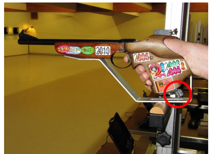
Anschlagart: „Freie Pistole Auflage“ (Ein Anschlagen des Ladehebels an der Waffenaufgabe darf nicht möglich sein)

Die Hand des Schützen umfasst den Pistolengriff. Der Handballen oder der Pistolengriff an seiner tiefsten Stelle, gelten als Auflagepunkt der Pistole auf der Auflage. Das Handgelenk muss im Anschlag völlig frei sein. Ein Arretieren oder Anschlagen seitlich und auf der Auflage ist nicht gestattet.