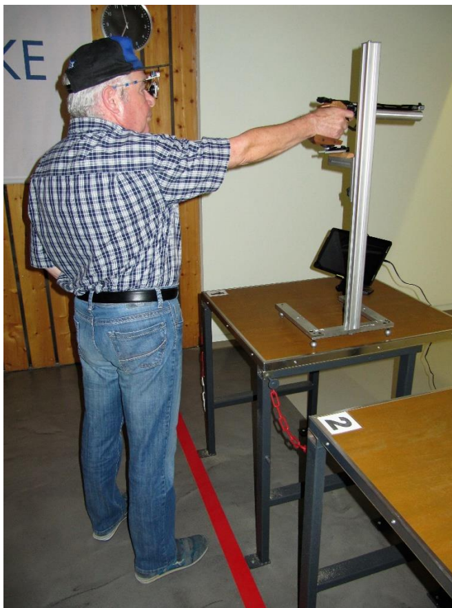
Anschlagart: „Luftpistole Auflage“