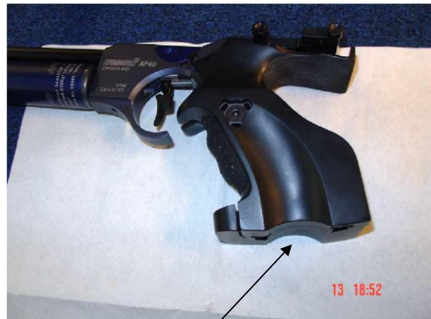
Griffausfräsung nicht erlaubt